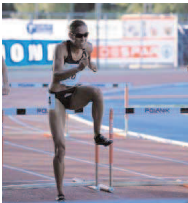
La pluricampionessa mondiale Lolo Jones

Determinanti i sostegni di alcuni organismi facenti parte del Comitato Sport Cultura Solidarietà, che hanno creduto nell'alta qualità sportiva e sociale della manifestazione; la Confindustria Udine e Friuladria Crédit Agricole sono partner principali dell'evento, a cui si affiancano il Progetto Gemona Città dello Sport, le aziende quali Amga, SSM, Latterie Friulane, Mondo, Moroso, Aspiag-Despar. Ancora fra gli inserzionisti Ricoh Italia, Centro Friuli, Dario Campana, Immobiliare Friulana Nord, Mercato Nuovo, Confartigianato Udine Servizi, IFAP, Conditerm, Arkimede, Selekt, Associazione Maratonina Udinese, Inarco, Mercatone Uno, La Fattoria, Hotel President, Hotel Smeraldo, Hotel Fra